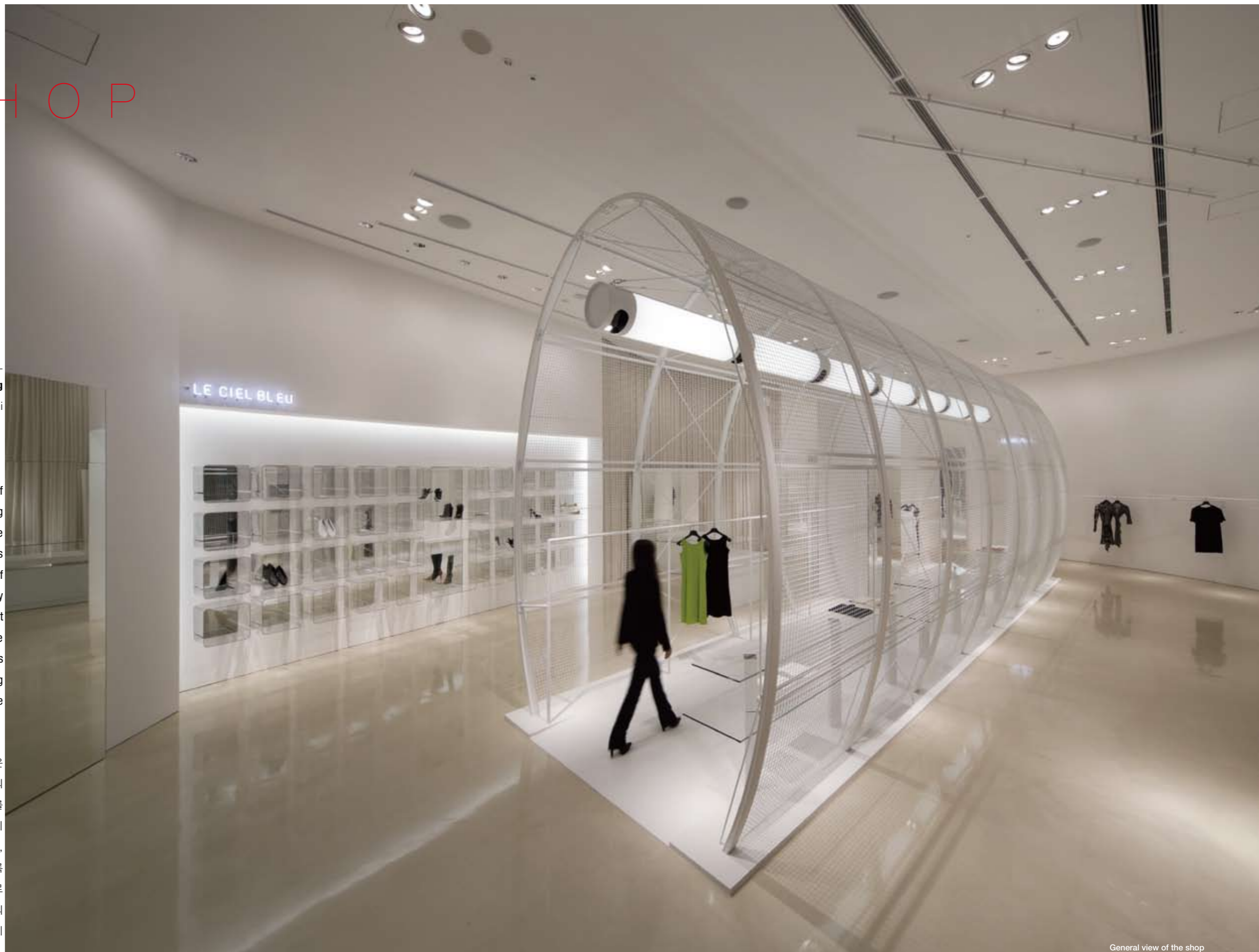
General view of the shop

LUCUA라는 복합매장 내에 디자인된 이 상점은 천장고가 5m이고 면적이 278㎡에 달하는 고급스러운 건축 공간이다. 오츠카 노리유키는 이 공간에 세세한 디자인뿐만 아니라 서로 대립하는 두 가지의 전반적인 콘셉트를 동시에 표현하고자 했다. 그가 제안한 디자인은 또 다른 건축 공간을 품고 있는 내부를 만드는 것으로, 이 내부 공간은 스스로 지지가 되는 철망 구조로 만들어진 하나의 실린더이다. 그는 이 실린더와 주변 공간이 너무 긴밀하게 통합되지 않기를 원했고, 이에 따라 실린더의 규모가 설정됐으며, 실린더는 의도적으로 건물의 축에서 벗어나게 배열됐다. 또한, 그는 이 공간이 디자인의 중심이 되도록 실린더 내부에 주문 제작된 조명 기구를 매달아 설치했다. 전체 매장은 밝은 색채를 활용한 흰색 공간으로 표현된다. 백색의 공간은 색채와 혼연일체가 되지만 모종의 절제미를 유지하며, 특수하게 제작된 금속의 금속성 바닥은 공간에 있는 모든 오브제의 형태를 돋보이게 해준다. 매장은 바로 이러한 디자인을 통해 이 곳가만의 독특함과 풍격을 구현했다 글· 노리유키 오츠카