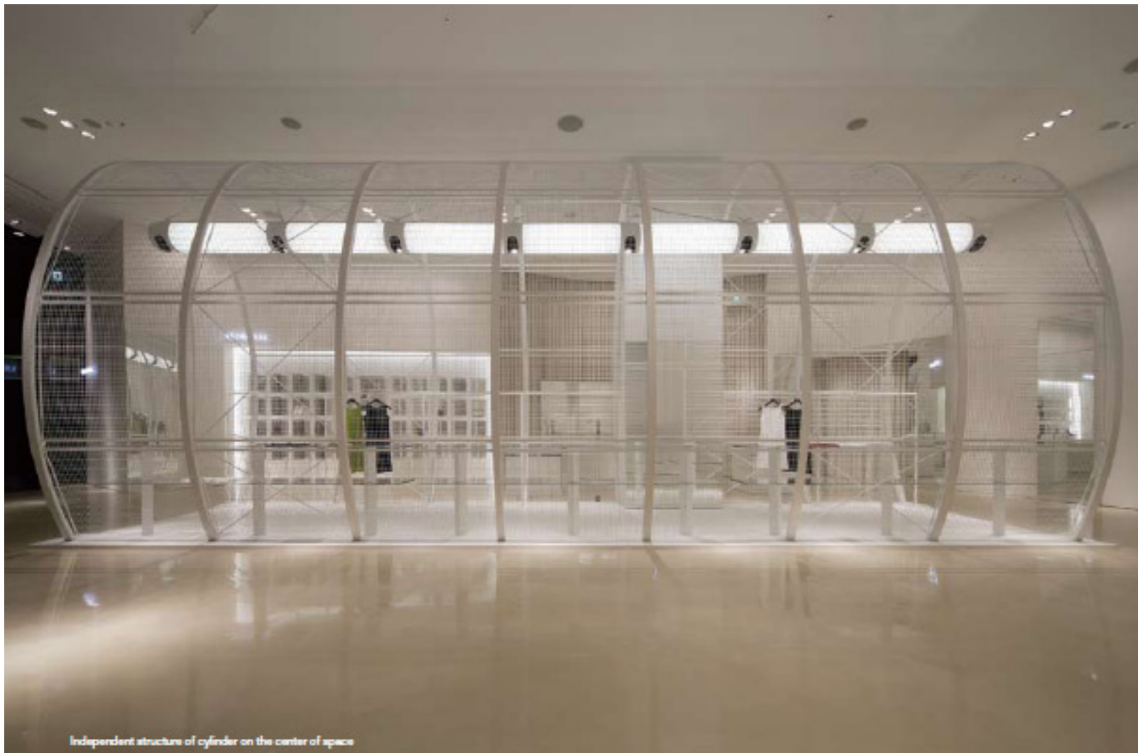
Independent structure of cylinder on the center of space