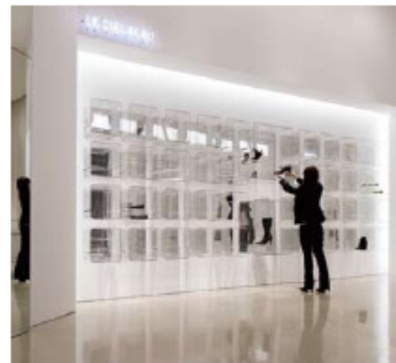
Shoes are displayed on the wall displaying structure