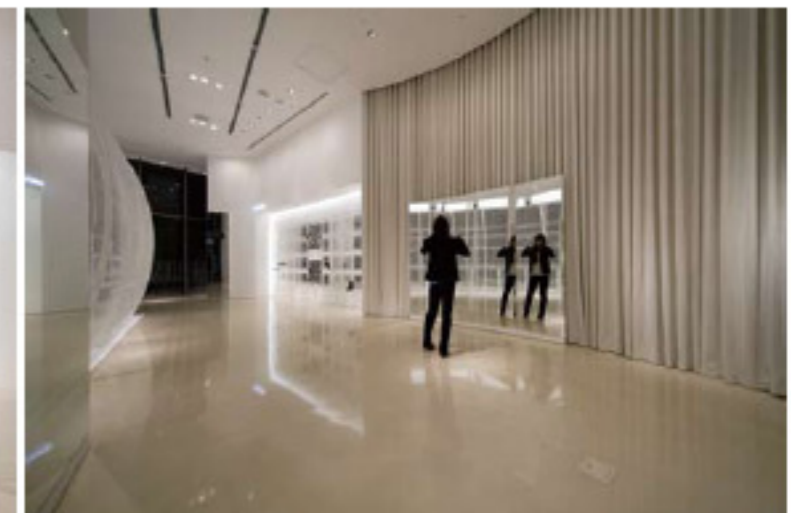
Fitting room's wall was made by big curtain