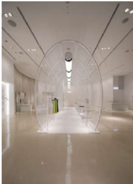
Cylinder made with self-supporting mesh structure