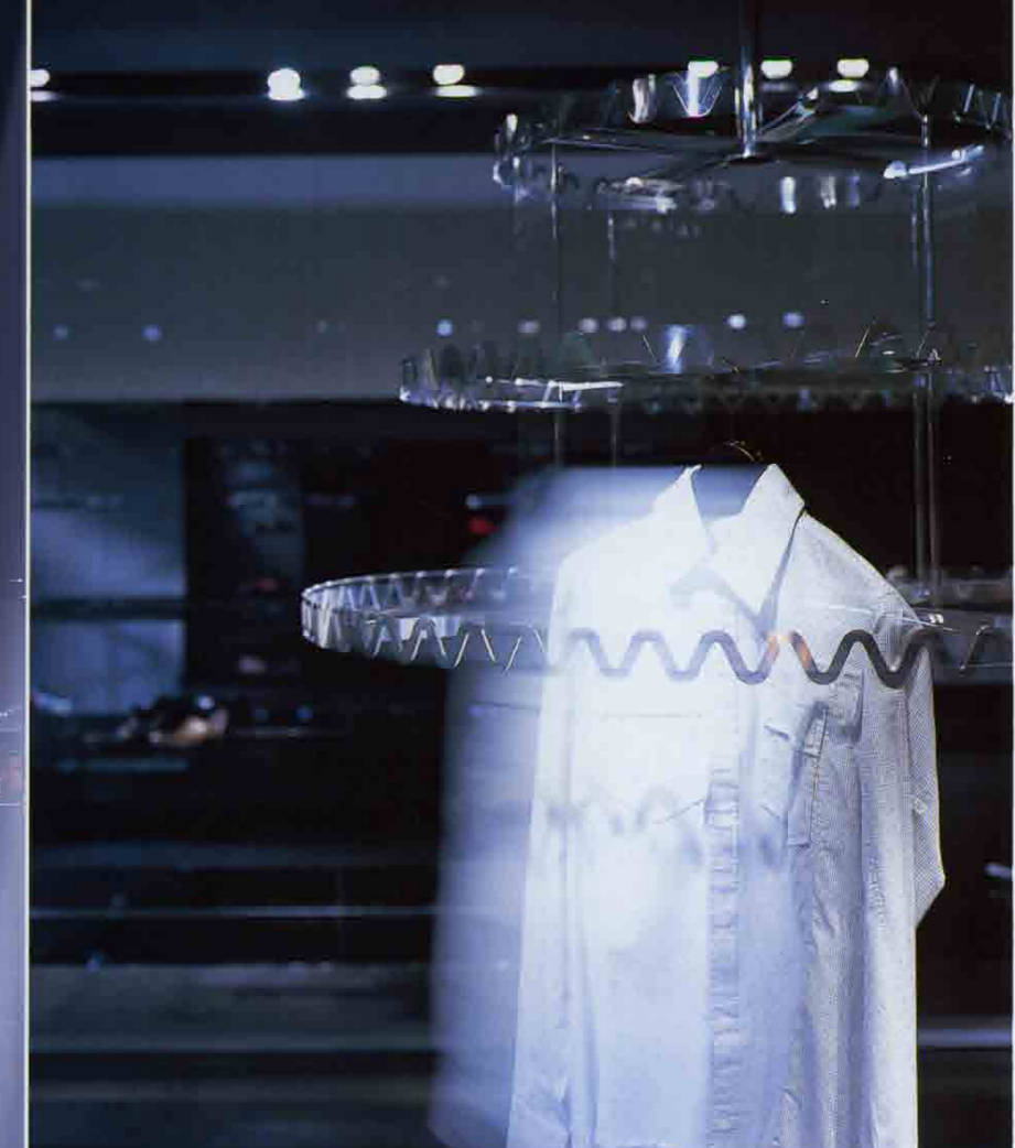
左/「東京エレガント」をコンセプトにした店内。共用部にも照明が施されている 上/回転式サークルラック