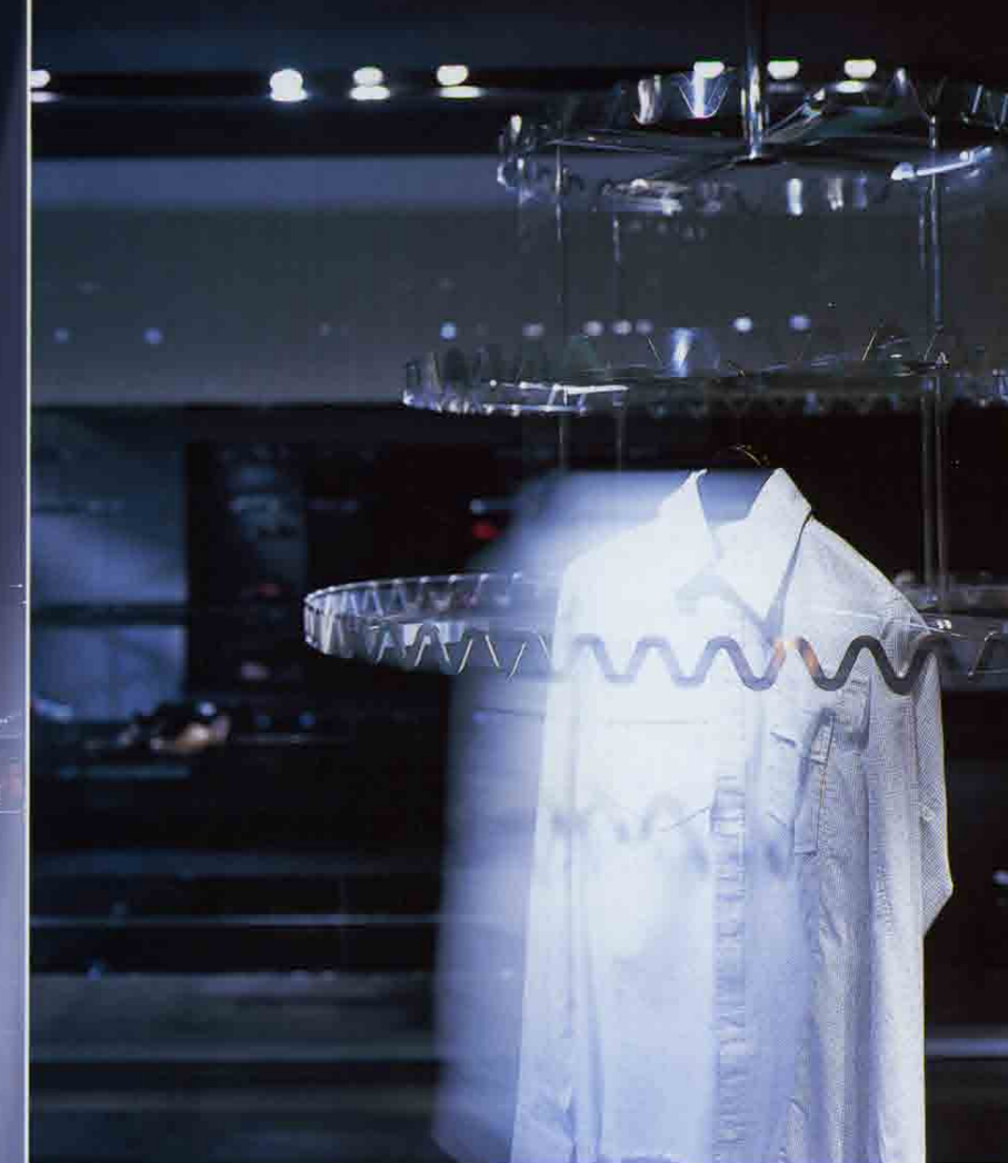
左/「東京エレガント」をコンセプトにした店内。共用部にも照明が施されている 上/回転式サークルラック

今回のリニューアルにあたって、これまでのブランドイメージを打ち破る店づくりを考えました。商品構成は、これまでのようなシューズやバッグだけでなく、写真家のデニス・