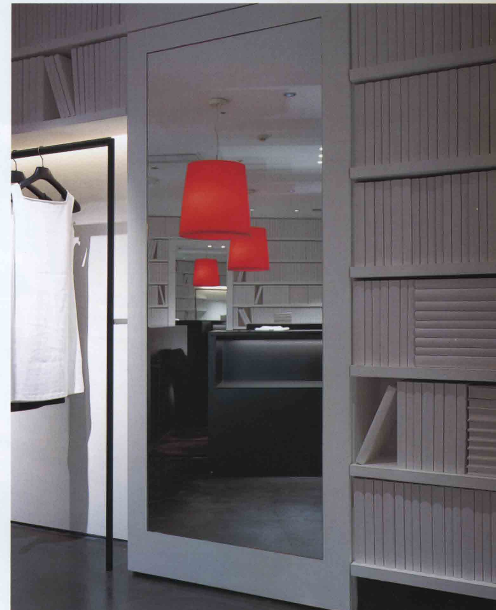
上/鏡越しにカウンター方向を見返す。本の厚みは3種類用意され、表情に変化を与える 下/フィッティングルーム前より店内を見返す