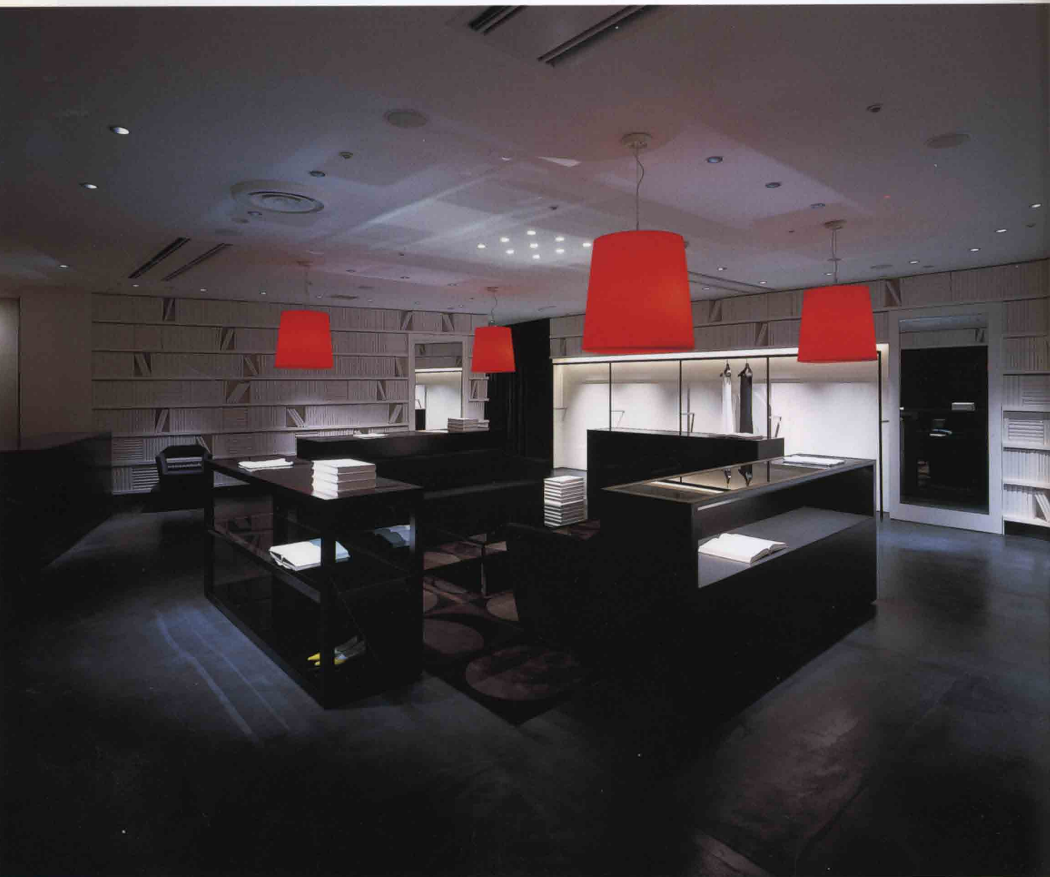
上/店内中央にはソファやテーブルが用意され、閲覧室をイメージしている。床にはオリジナルで製作されたカーペットが敷かれる 下/店内には汚れに強いコーティングが施された約2000冊の本が用意されている