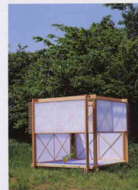
プリーツボックス / strato社ショ ールーム(イタリア) / 2003 2003年のミラノサローネ出品作 品(strato社とのコラボレーシ ョン)。可動式のミニマム空間でイ ンテリアデザインの屋外化を実 現。解体すればステーションワゴ ンに収納可。