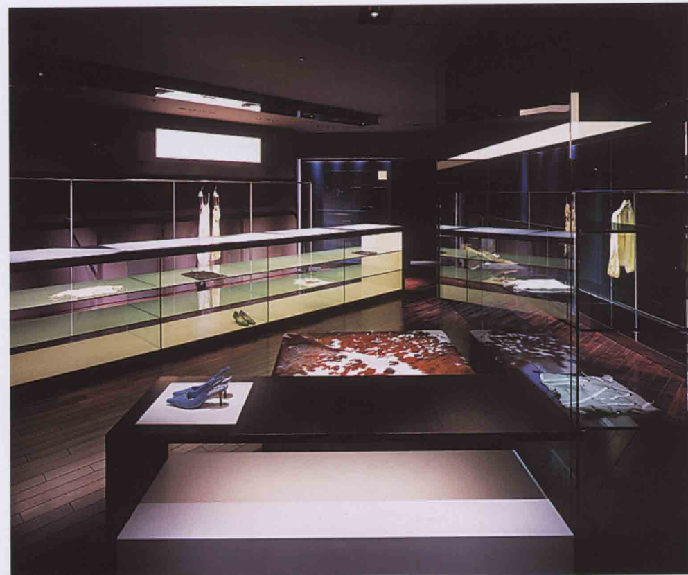
アクシアエクスレイトッド恵比寿店 / 東京都渋谷区恵比寿南 / 2005 アトレ恵比寿内4階。レストランのような落ち着いた照明のなか、 国内外からセレクトされた商品がレイアウトされるショップ。視覚だけ でなく、ほかの感覚もすべて満足させる空間。

おおつか・のりゆき 1960年福井生まれ。81年デ ザインスクール卒業後、渡 欧。帰国後の84年インテリ アデザイン事務所プラスチ ックスタジオアンドアソシ エイツにて勤務。90年大塚 ノリユキデザイン事務所設 立。「無」のようで「有」 であり、「混在」のようで、 "透明"である空間"をデザ インテーマに掲げ、主にプ ティックやレストランなど のインテリアデザインを手 掛ける。NGKデザインコン テスト優秀デザイン賞をほ じめ、受賞多数。