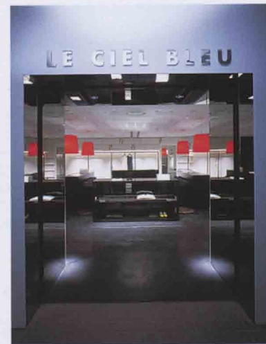
ルシェルブルー札幌店 / 北海道札幌市北区 / 2004 札幌駅内バセオB1Fのショップ。図書館からイ メージされる知的美学をファッションスペース として装置化。ファッションがもつ潜在的な魅 力を引き出し、棚に並んだ2000冊の真白い装丁 の書物が品格と優雅さを示す。

大塚則幸さんはお洒落なインテリアデザイナーである。私がすぐに頭に浮かべるのは、ミラノにあるファッションブティック「プリモプリマ」である。石畳の街の荘厳な建物のなか、真っ白な空間にオレンジ色のアクセントカラーのインテリアがひと際目を引いた。また、神戸三宮にある「アルテミス 三宮」は、小さいスペースながら真っ白な壁面に天井から光のシャワーが降り注ぐ高密度な空間。主役であるジュエリーを一層鮮やかに輝かせる。そのほか、恵比