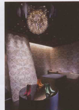
スタニングアー心斎橋店 / 大 阪府大阪市中央区 / 2004 伝統的な紋様をデジタル化して、 壁面のデザインにしている。天井 のペンダントからの光がタイルの 表面に反射し、シックでラグジュ アリーな空間が生まれる。日航ホ テル1階。